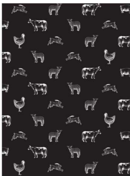
0383X FOGLI OVTENE ZERO NERO 37x50 MY38 ST. GEN1C BIANCO