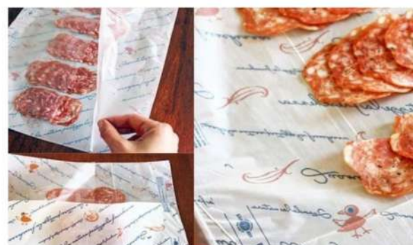
03887 BYOVTENE BIANCO 28x40 MY43 ALI HD12