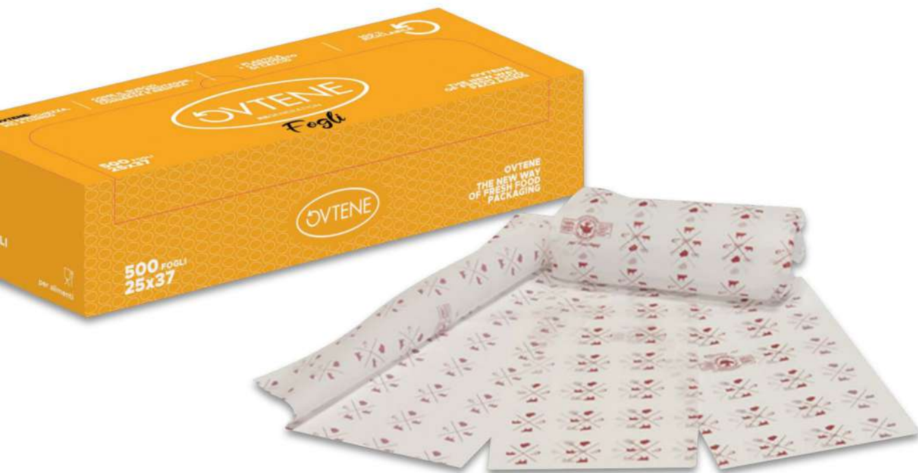
0385E FOGLI OVTENE ZERO 25x37 MY38 ST. GEN