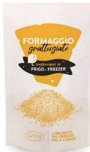
0384K SACCO OVTENE ST. FORMAGGIO GRATT. 20x30+4