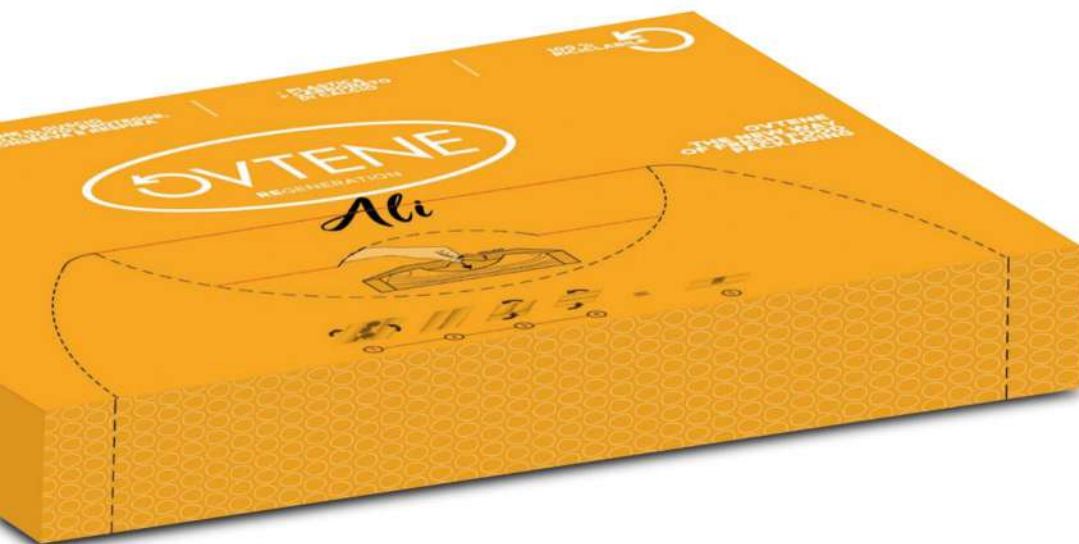
03883 BYOVTENE BIANCO 24x36 MY43 ALI HD12