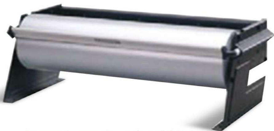
03840 DISPENCER NERO PER BOBINE OVTENE cm 35 H25 x ROTOLO cm 35