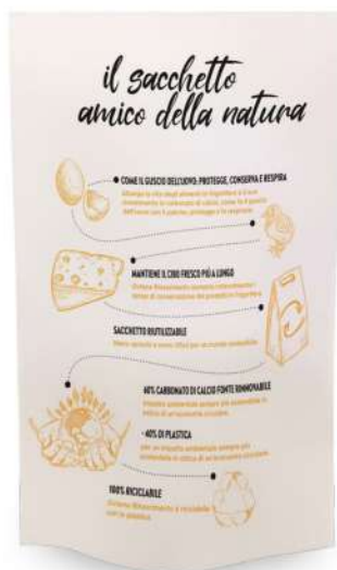
0384K SACCO OVTENE SALUMI 25x35+4 GENER.