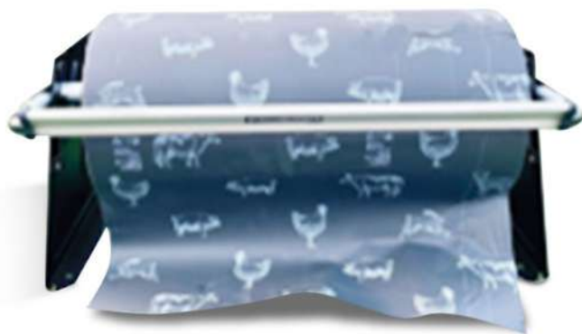
03843 OVTENE NERO BOBINA H35 38MY ST. GEN.1C B.CO